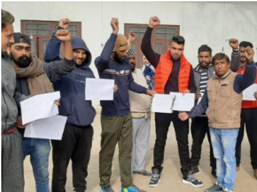
ജനുവരി 13 ന് പഞ്ചാബിലെ ജലന്തറിൽ ആർസിഎഫിന്റെ നേതൃത്വത്തിൽ കാർഷിക നിയമങ്ങളുടെ കോപ്പി കത്തിക്കുന്നു.