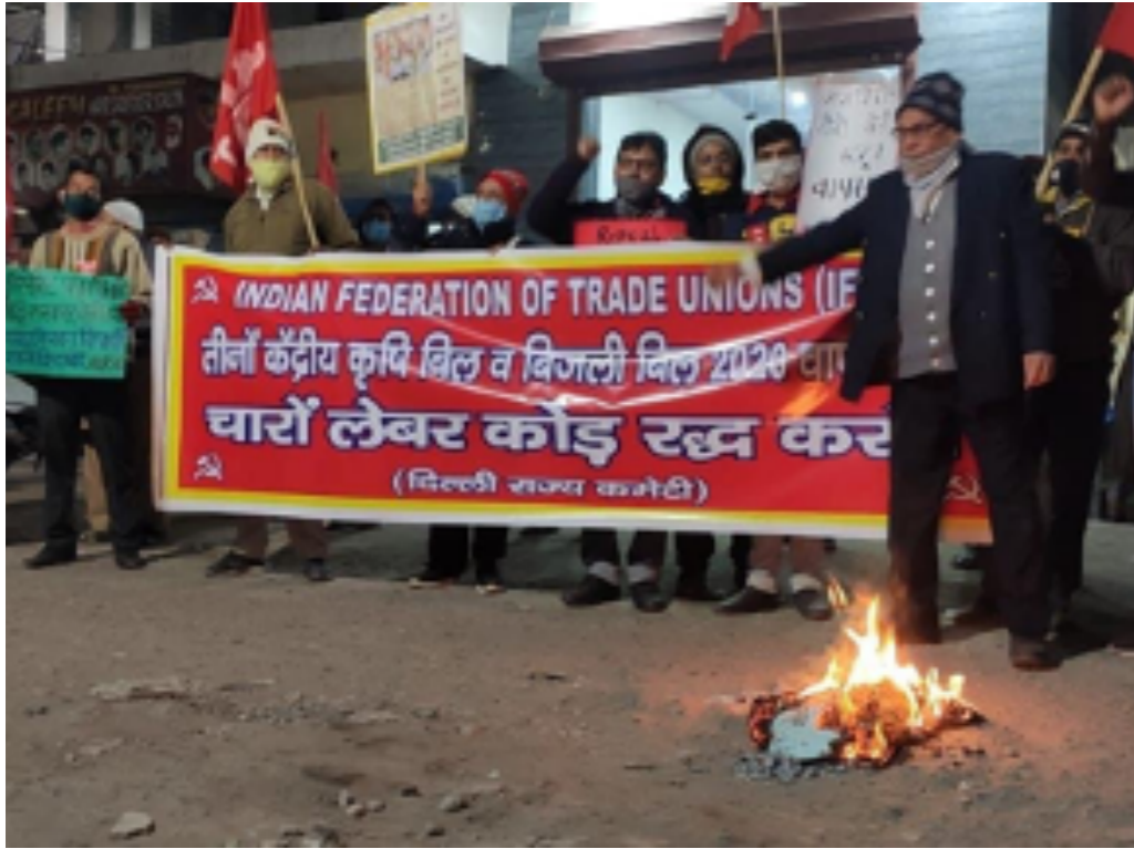
ജനുവരി 13 ന് ടിയൂസിഐ, എഐആർഎസ്, ഐഎഫ്ടിയു, എഐകെകെഎസ് സംഘടനകളുടെ നേതൃത്വത്തിൽ ദൽഹിയിൽ സംഘടിപ്പിച്ച പ്രതിഷേധം