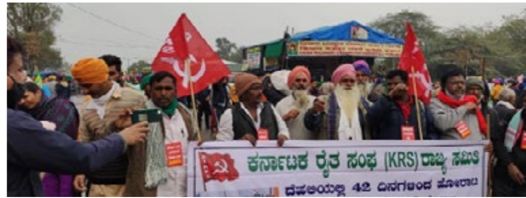
കർഷക പ്രക്ഷോഭത്തിന് ഐക്യദാർഢ്യം പ്രഖ്യാപിച്ചുകൊണ്ട് കർണ്ണാടകയിൽ നിന്നുള്ള വിപ്ലവ സാംസ്കാരിക വേദി (ആർസിഎഫ്) യുടേയും അവിലേന്ത്യാ വിപ്ലവ കർഷക സഭയുടേയും സഖാക്കൾ ദൽഹി സിംഗു അതിർത്തിയിലെത്തിയപ്പോൾ