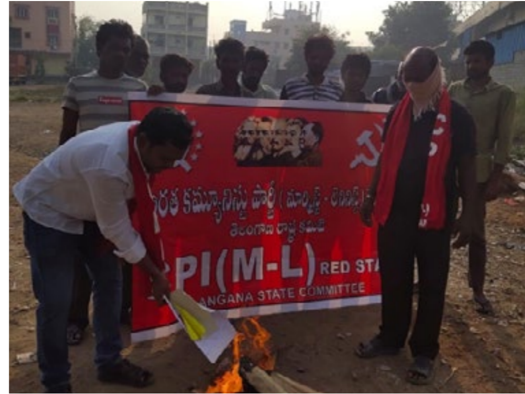
ജനുവരി 13 ന് തെലങ്കാനയിലെ ഹൈദ്രാബാദിൽ സിപിഐ (എംഎൽ) റെഡ് സ്റ്റാറിന്റെ നേതൃത്വത്തിൽ നടത്തിയ പ്രതിഷേധം.