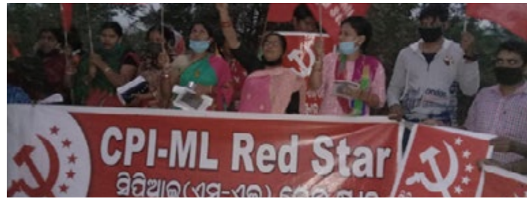
ജനുവരി 13 ന് സിപിഐ (എംഎൽ) ഗോർഡ ജില്ലാ കമ്മിറ്റിയുടെ (ദ്രോഷ) നേതൃത്വത്തിൽ പുതിയ കാർഷിക നിയമങ്ങളുടേയും തൊഴിൽ നിയമങ്ങളുടേയും കോപികൾ കത്തിക്കുന്നു.