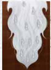
Cover image @wijith